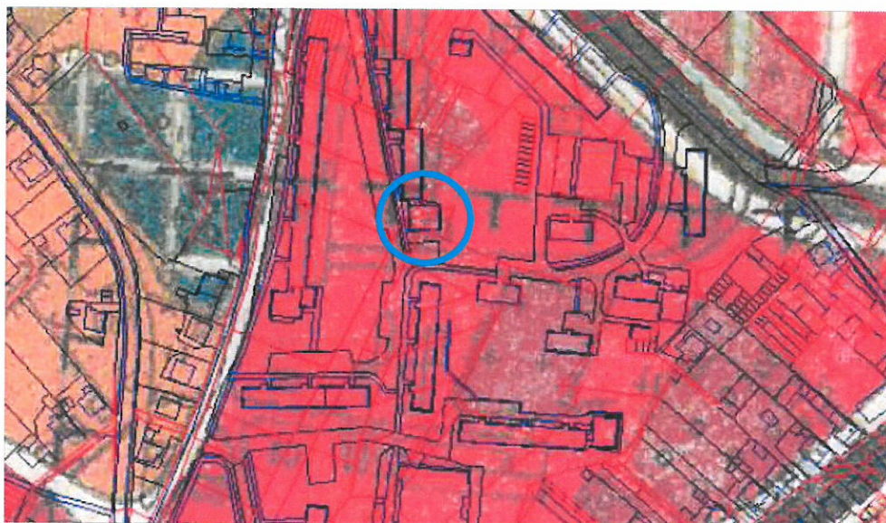
výrez z ÚPN-A B.Bystrica