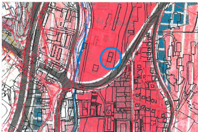
výrez z ÚPN-A B.Bystrica