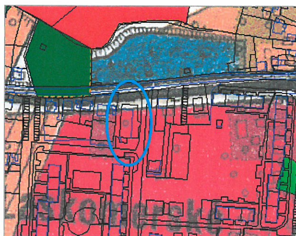
výrez z UŠ –Dotvorenie priestoru B.Bystrica-Podlavice-